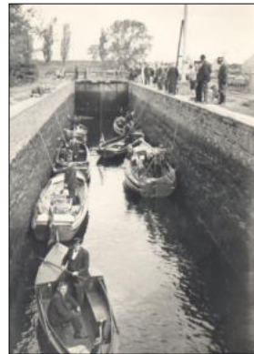
In der Schleuse