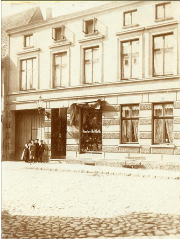
Parchim, Ziegenmarkt Nr. 12 im Jahre 1909 (Pflasterung des Ziegenmarktes noch mit Feldsteinen!)