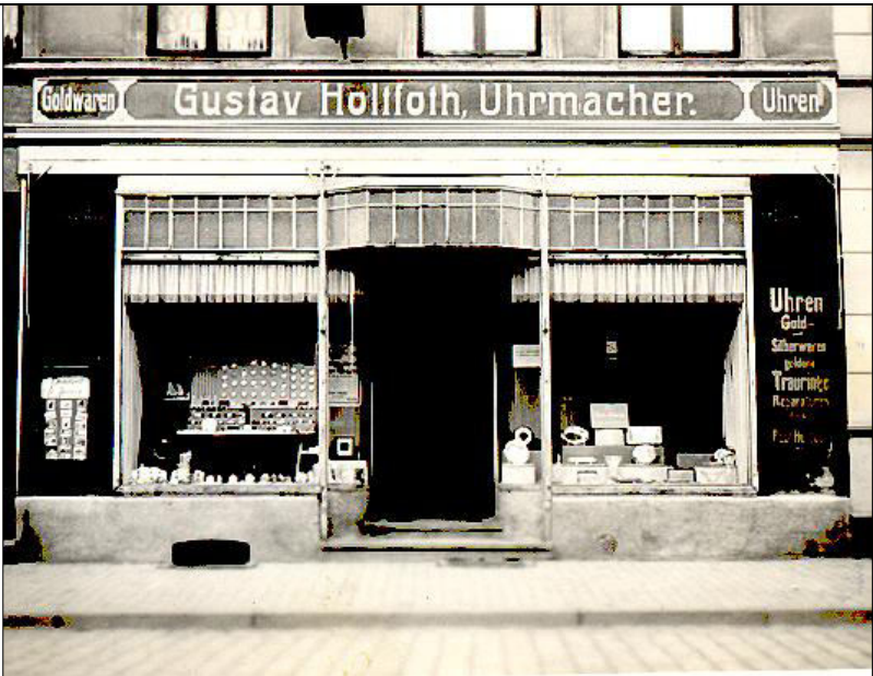
Ziegenmarkt Nr.12 (Der Ziegenmarkt ist bereits mit Kunststeinen gepflastert)