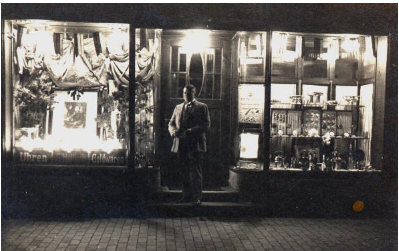
Schaufensterdekoration zur 700- Jahrfeier der Stadt Parchim vom 10.-12.Sepember 1926 (Paul Holtfoth)